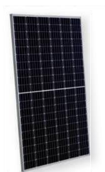
Mòduls HC Mono Perc