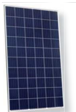
Mòduls Eagle Poly