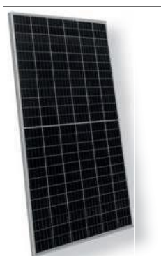
Mòduls HC Poly